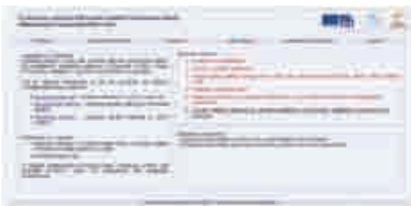
OBR.1 Úvodní strana nástroje

Evaluacní nástroj Rámcové vlastní hodnocení školy je koncipován jako průvodce vlastním hodnocením školy a jeho cílem je usnadnit hodnotiteli práci při tvorbě evaluační zprávy. Nástroj je určen nejen úplným začátečníkům, kteří s autoevaluací teprve začínají. Vzhledem k jeho variabilitě ho mohou využít i ti, kteří již mají s autoevaluací bohaté zkušenosti. Tiskuté podklady generované na míru podle přání uživatele mohou podpořit diskusi mezi kolegy a rozdělení hodnotících činností podle oblastí. Nástroj je určen k vlastnímu hodnocení všech oblastí kvality školy, které požaduje vyhláška č. 15/2005 Sb. a její novela č. 225/2009 Sb. Použitím tohoto nástroje je splněna legislativní povinnost vyžadovaná školským zákonem (Zákon č. 561/2004 Sb.) a výše uvedenou vyhláškou a její novelou. Nástroj je k dispozici na portálu evaluačních nástrojů www.evaluačnínastroje.cz . Věnujte pozornost i průvodním metodickým materiálům, i když je nástroj vytvářen se snahou pro intuitivní ovládnání.