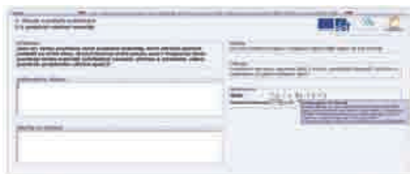
OBR.2 Pole pro hodnocení kritéria

K podoblastem jsou formulovány kritériální otázky. Například formulace pro oblast 2 a podoblast 2.3: