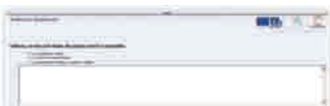
OBR.4 Podoblasti, ve kterých škola dosahuje dobrých výsledků

Druhým souhrnným výstupem je vygenerování podoblastí, ve kterých škola dosahuje dobrého hodnocení, a podoblastí, ve kterých je třeba dále se zlepšovat. Hodnotitel má možnost získané výsledky posoudit vzhledem k cílům školy, stanoveným prioritám apod. Posledním krokem, který logicky doplňuje autoevaluační proces, je stanovení plánů, námětů a opatření pro další zlepšování.