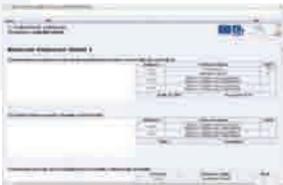
OBR.3 Souhrnné zhodnocení oblastí

Na základě předchozího detailního zhodnocení oblastí jsou automaticky vygenerovány výsledky tohoto hodnocení, které většinou slouží jako podklady k souhrnnému zhodnocení. V rámci nástroje jsou koncipovány dva typy tohoto zhodnocení, což odpovídá požadavkům vyhlášky (viz níže). Nejprve se jedná o souhrnné zhodnocení oblasti Podmínky ke vzdělávání a na ni navazují ostatní oblasti, jejichž výsledky se hodnotí právě vzhledem k Podmínkám vzdělávání, resp. vzhledem k personálním podmínkám a materiálním a ekonomickým podmínkám dohromady.