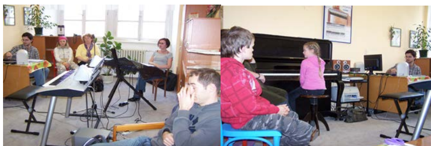
Obr. 1 a 2: Ukázky ze semináře – dílničky klávesového oddělení (duben 2010)

Semináře - dílničky jsou v podstatě vzájemné návštěvy, vzájemná setkání několika učitelů se svými žáky (zpravidla 3 – 5 učitelů a 3 – 5 žáků), při nichž žáci předvedou úryvky ze svých hudebních vystoupení.