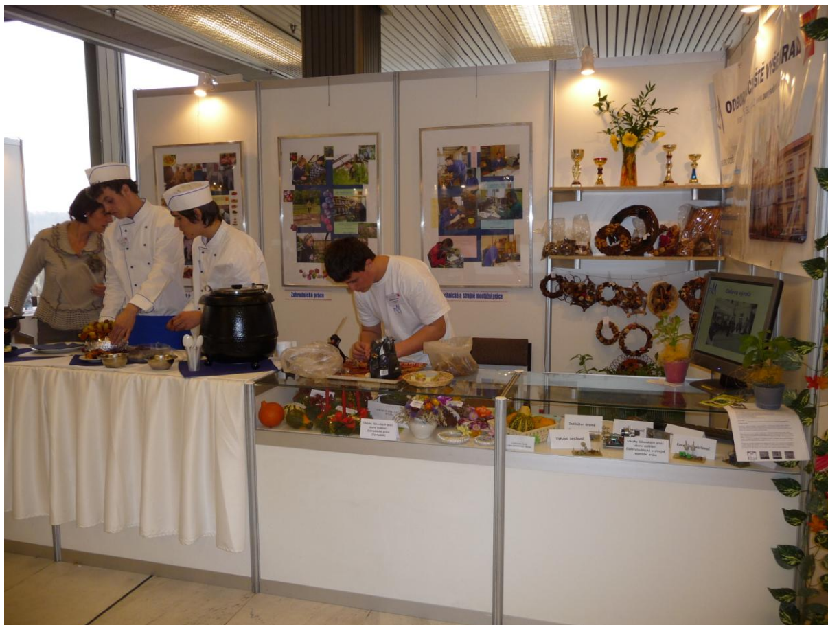
OU Vyšehrad se prezentuje na akci Schola Pragensis.