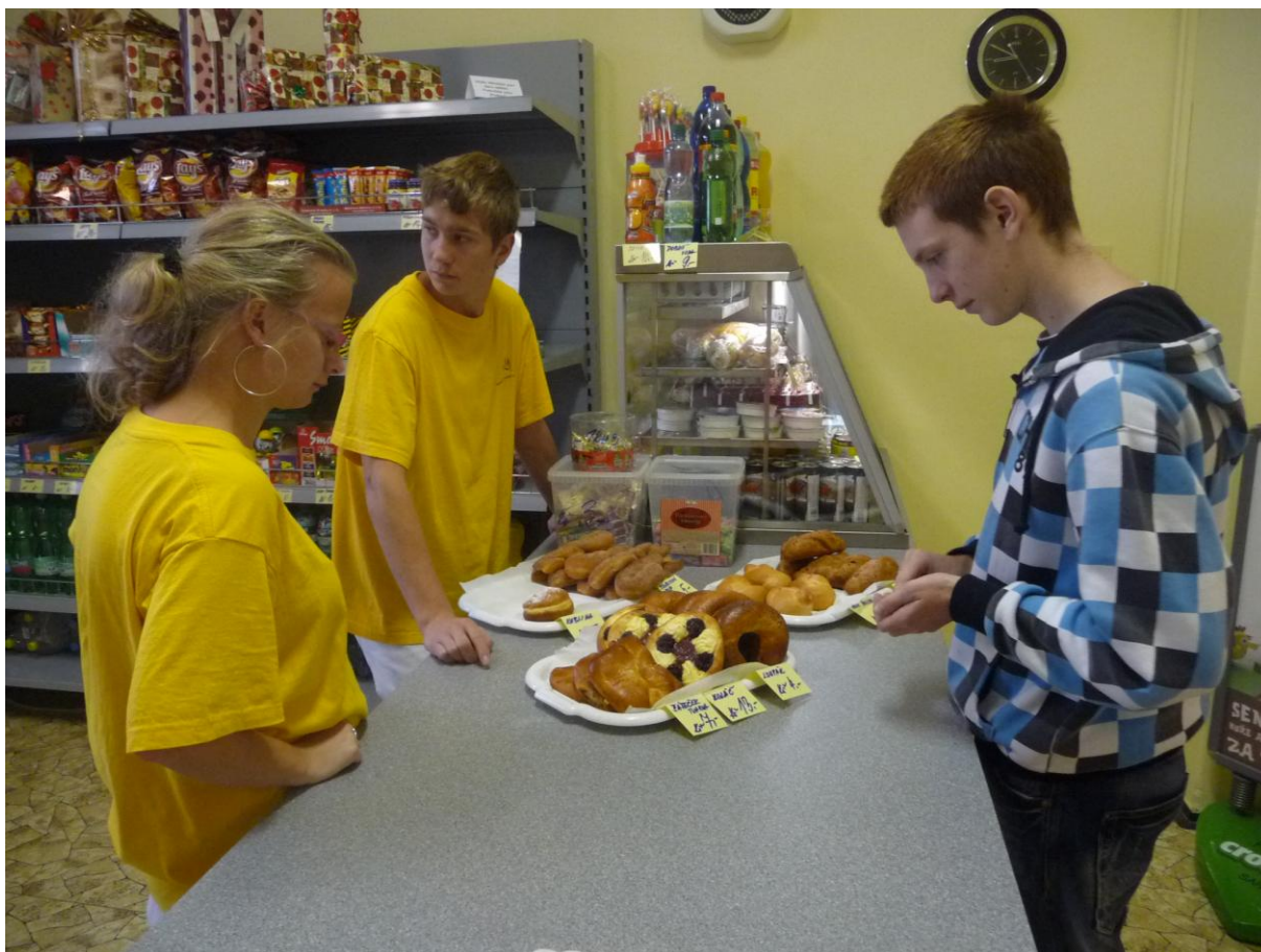
Školní bufet, který provozují žáci školy v rámci svého odborného výcviku.