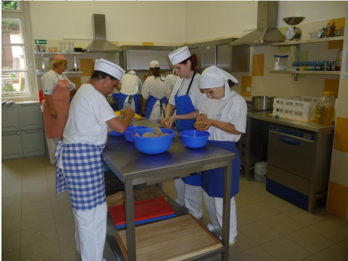
Školní kuchyňka určená pro odborný výcvik

Na fotografiích můžeme vidět prostory pro pracovní výcvik zřízené přímo ve škole. Jejich cílem je co nejdříve simulovat reálné prostředí, ve kterém budou absolventi školy pracovat. Na prvním snímku vidíme školní kuchyňku, na druhém snímku je školní bufet, který provozují sami studenti pod dohledem určeného učitele odborného výcviku. Samozřejmostí je také prodej výrobků vytvořených studenty ve škole v rámci odborného výcviku.