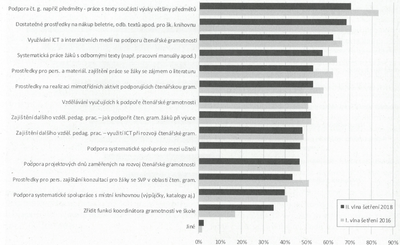
Na jaké překážky při realizaci činností v rámci rozvoje čtenářské gramotnosti narážíte?