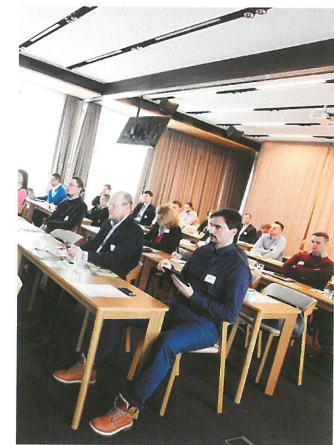
O seminář k řízení firemní výkonnosti organizované Českou asociací interim managementu měly zájem desítky lidí z řad manažerů i majitelů firem.

Cech klempířů, pokrývačů a tesařů ČR zaznamenává v poslední době výrazný nárůst zájmu o členství. V minulém roce bylo přijato 15 nových členů a letos za necelé dva měsíce jsou registrováni již 4 nové přihlášky. To představuje trvalý nárůst členské základny o více než 10 % ročně. Nejbližší významnou akcí cechu je valná hromada, která se seje 29. března ve Svatce na Vysočině. Důležitým bodem jednání budou určitě mistrovské zkoušky. Cech KPT na nich aktivně spolupracuje s Hospodářskou komorou a považuje je za nezbytný nástroj pro udržení kvality řemesla.