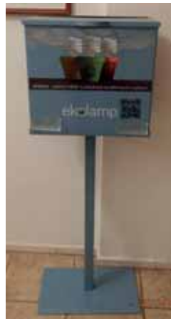
Sběrná nádoba EKOLAMP na Úřadu městyse Lomnice (viz. foto)

Více se o problematice nakládání s nefunkčními zářivkami dočtete na www.ekolamp.cz