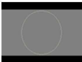
24 Formát letterbox

19 2. vytvořením obrazového formátu letterbox 20 (výsledný obraz má podobu dopisní obálky 21 s černými pruhy nad a pod aktivní částí 22 obrazu) 23