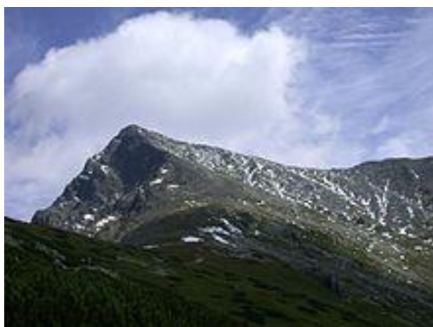
Kriváň od jihozápadu

Seznam vrcholů ve Vysokých Tatrách obsahuje hlavní vrcholy Vysokých Tater.