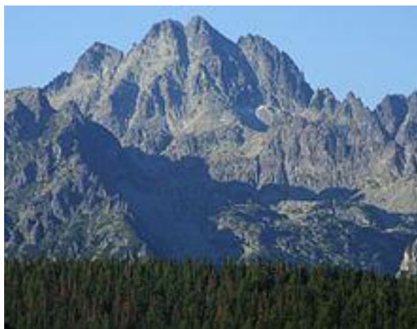
Vysoká uprostřed tzv. Koruny Tater