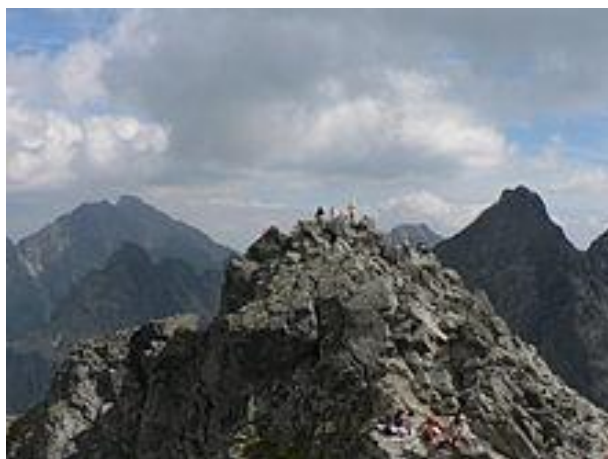
Vrchol Rysů z polského vrcholu