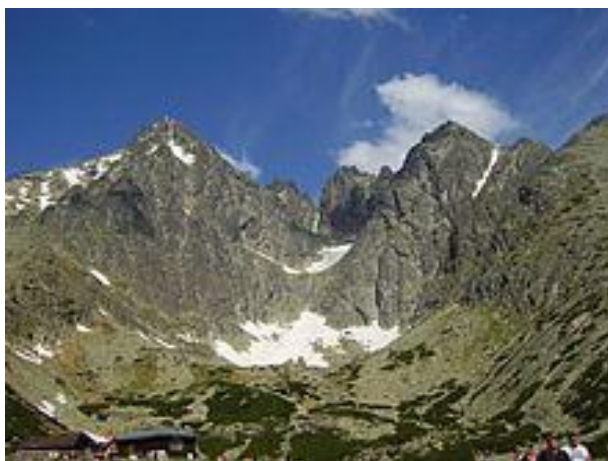
Lomnický štít ze Skalnatého plesa