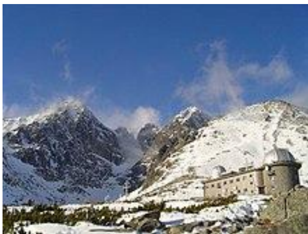
Observatoř Skalnaté pleso

Park byl zřízen 1. ledna 1949. Je nejstarším národním parkem na Slovensku. V roce 1987 byly ke stávajícímu parku přidruženy Západní Tatry. Roku 1993 se stal TANAP biosférickou rezervací UNESCO. V roce 2003 byly upraveny hranice území parku a ochranného pásma. Od roku 2004 je park součástí sítě evropsky významných lokalit Natura 2000.