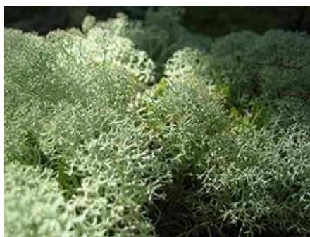
Obr. 1: Dutohlávka horská ( Cladonia stellaris ), keříčkovitá stélka