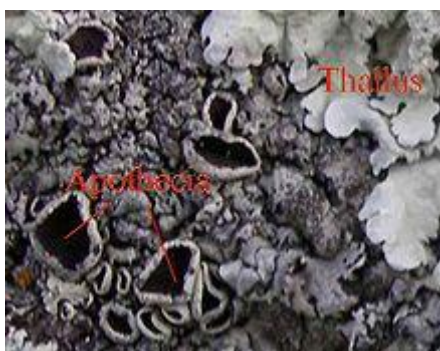
Obr. 4: Dva hlavní způsoby rozmnožování lišejníků. Nepohlavně se rozmnožují fragmentací stélky (thallus), pohlavně jen houba díky plodnicím (zde apothecium)

Lišejníky se rozmnožují především vegetativně. Důvodem je zřejmě to, že houby se ve většině případů neobejdou bez svého fotobionta. Někdy vzniká nový lišejník prostou fragmentací stélky na několik částí. Hlavními mechanismy vegetativního rozmnožování jsou ale tzv. izidie a soredie, které vznikají fragmentací stélky. Izidie jsou dobře viditelné výrůstky stélky, které se odlupují od mateřské stélky a dorůstají v nového jedince. Soredie jsou malé (pod 1 mm) a vznikají jako prášek na tzv. sorálech, místech, kde není stélka lišejníku přikrytá kůrou.