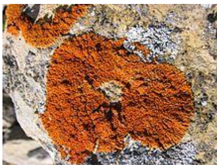
Obr. 6: Lišejník Xanthoria elegans se vyskytuje i v nadmořské výšce 7000 m n. m.