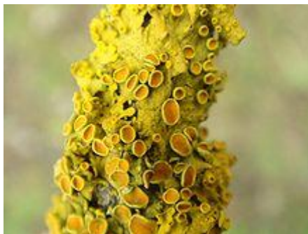
Obr. 3: Lišejník s nápadnými plodnicemi (apothecii, které obsahují askospory) sloužící k rozmnožování mykobionta, zpravidla však uvnitř obsahující i fotobionta

Anatomie lišejníků je značně odvislá od mykobionta, který utváří většinu stélky, ale i od fotobionta. Pokud mykobiont může spolupracovat s více druhy fotobiontů, vznikají pak často i velmi rozdílné stélky, rozlišitelné pouhým okem.