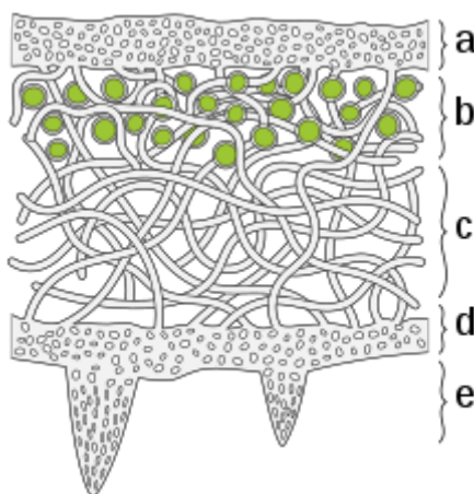
Obr. 2: Průřez heteromerickou stélkou běžného lišejníku. Skládá se ze dvou vrstev kůry (typické pro korovité druhy), uprostřed níž je dřev s řasovou vrstvou. Na spodní korovou vrstvu navazují rhiziny, které upevňují stélku k podkladu.