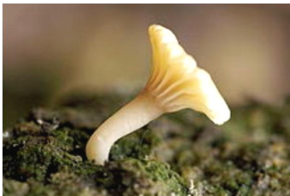
Obr. 5: Houba rodu Lichenomphalia , která tvoří bazidiolišejníky

Zatímco dříve se lišejníky řadily do zvláštního rostlinného oddělení, po poznání jejich podstaty jakožto hub s endosymbiotickým fotobiontem se dnes zásadně klasifikují podle mykobionta, podle pravidla „jedna houba – jeden lišejník“. Jedná se tedy o zástupce říše houby (Fungi), podříše Dikarya, kteří však jakožto lišejníky netvoří společně žádnou přirozenou skupinu. Známe 13 500 – 17 000 lichenizovaných hub. Mezi ně patří zejména vřeckovýtrusné houby (Ascomycota), ale vzácně (méně než 2 %) i stopkovýtrusné houby (Basidiomycota). U některých lichenizovaných hub se nepodařilo pozorovat pohlavní rozmnožování, které by umožnilo klasifikaci do jedné z hlavních skupin Dikarya; v některých systémech jsou proto prozatím podřazeny umělé skupině Deuteromycota a o jejich zařazení mohou rozhodnout v budoucnosti až molekulární analýzy jejich genomu.