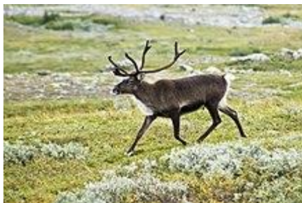
Obr. 7: Sob polární se často živí lišejníky. To se odráží například v českém i vědeckém jméne dutohlávky sobí ( Cladonia ranginifera )

Lišejníky najdeme téměř všude s výjimkou volného oceánu. Lišejníky byly například objeveny pouhých 300 kilometrů od pólu. Terčovník pohledný ( Xanthoria elegans ) byl nalezen i v nadmořské výšce 7000 m n. m. Lišejník misnička jedlá ( Lecanora esculenta ) se vyskytuje na poušti Sahara. Někdy rostou lišejníky i ve vodě, jako například nitroplodka potoční ( Dermatocarpon rivulorum ). I když jsou schopné porůstat všechny substráty, nejčastěji je nalézáme na kamenech a skalách, na půdě a jako epifyty na stromech a keřích. To jsou místa, kde je malá konkurence vyšších rostlin, proti nimž se lišejníky například v hustém lesním podrostu neprosadí. Mnoho druhů také vyžaduje stabilní substrát (horniny), protože roste pomalu. Na druhou stranu existují i mnohé efemery, které osídlují také rychle tlející dřevo, listy dřevin v tropech či kamenité suti.